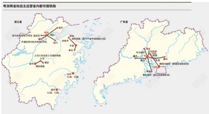
Слева – карта провинции Чжэцзян, справа – провинции Гуандун

соответствии с решением центральных властей, принятым еще в 2019 г., в управлении местными железными дорогами всё большую роль будут играть регионы. Пилотными провинциями стали одни из наиболее экономически развитых – Гуандун (южный Китай) и Чжэцзян (восточный Китай, рядом с Шанхаем). Нововведение касается внутренних железнодорожных маршрутов протяженностью 50-100 км.